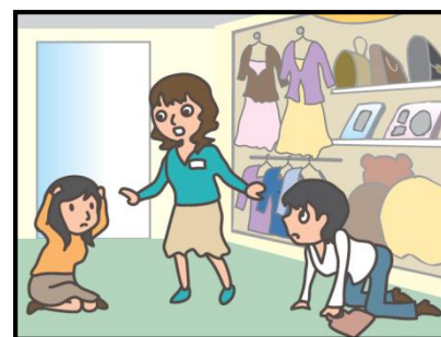
お店では、あわてず係員の指示に従って！