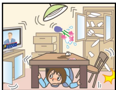
頭を守って、安全な場所に避難！

緊急地震速報を見聞きしたときの行動は、まわりの人に声をかけながら「周囲の状況に応じて、あわてずに、まず身の安全を確保する」ことが基本です。